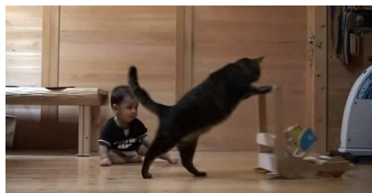
ネコ「違う、違う。 こうだよ」