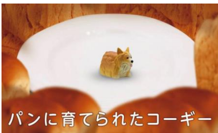
パンに育てられたコーギー

カプセルトイメーカーの株式会社 Qualia より 6 月に発売されるカプセルトイ「食べものに育てられた犬」シリーズが、最強可愛いのでみんな見て！ パンに育てられたコーギー ご飯に育てられたポメ 他 5 種 最高にシュールなガチャガチャが出ます。