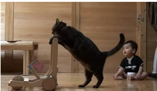
ネコ「こうやって歩くんだよ」