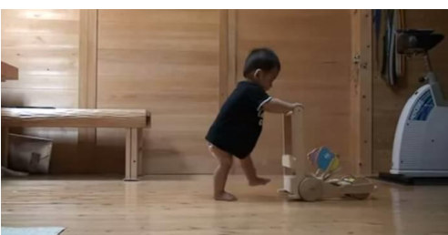
赤ちゃん「こうかな？」