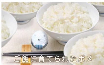
ご飯に育てられたポメ