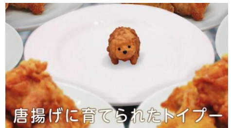
唐揚げに育てられたトイプードル